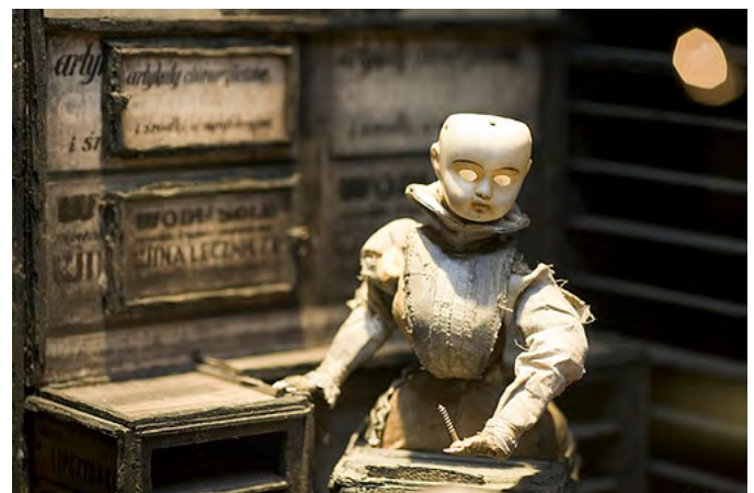
Les frères Quay